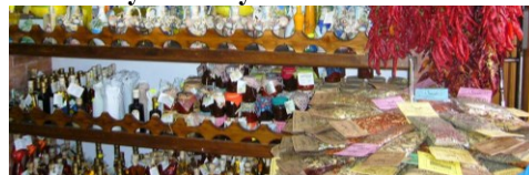
Typické ischitánské výrobky

Uvedené termíny jsou od soboty do soboty, v případě autobusové dopravy je odjezd z ČR vždy v pátek a návrat zpět v neděli po ukončení pobytu. V případě letecké dopravy je odlet a přílet sobota – sobota.