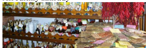
Typické ischitánské výrobky

Uvedené termíny jsou od soboty do soboty, v případě autobusové dopravy je odjezd z ČR vždy v pátek a návrat zpět v neděli po ukončení pobytu. V případě letecké dopravy je odlet a přílet sobota – sobota.